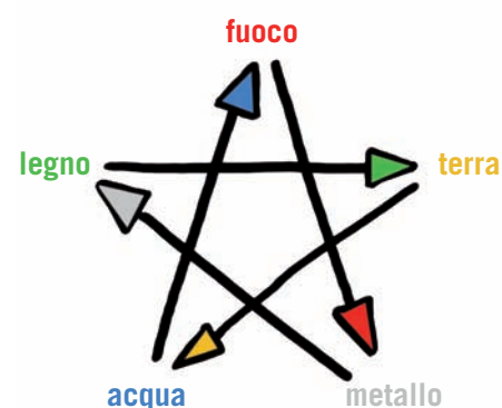
5 ... ma si bilanciano anche l'un l'altro (ciclo di controllo).