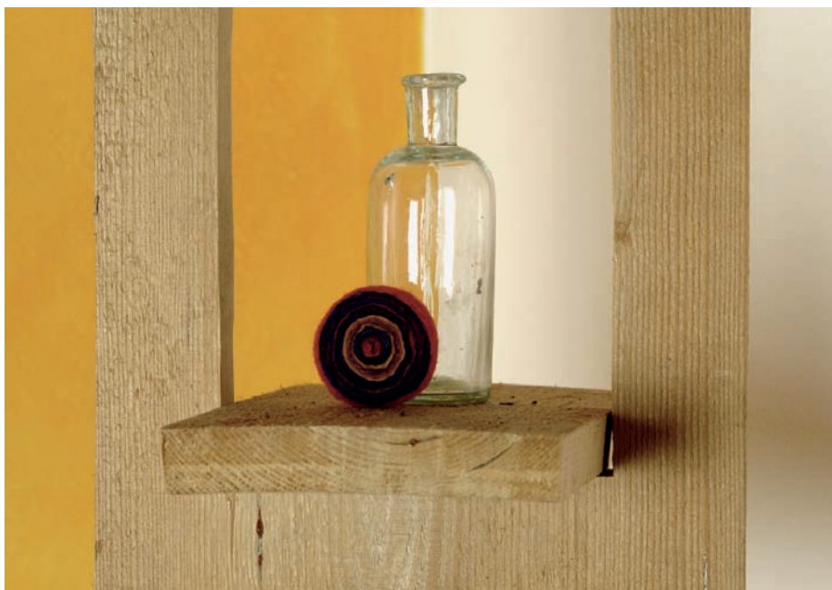
7 L'elemento terra, espresso nel colore, forma e materiale.

i pigmenti naturali la luce si rifrange in modo più morbido rispetto ai colori sintetici. Ne derivano casse di risonanza cromatiche simili ad un'orchestra che suona in un perfetto accordo nonostante l'individualità degli strumenti. I colori Corbusier assomigliano ad una siffatta orchestra. Nonostante la loro forte espressività, dialogano tra loro in modo rilassato. Sono le numerose terre naturali che come elementi portanti fondamentali della vibrazione riescono a catturare o a rendere dinamiche le forze Yin e Yang degli altri pigmenti.