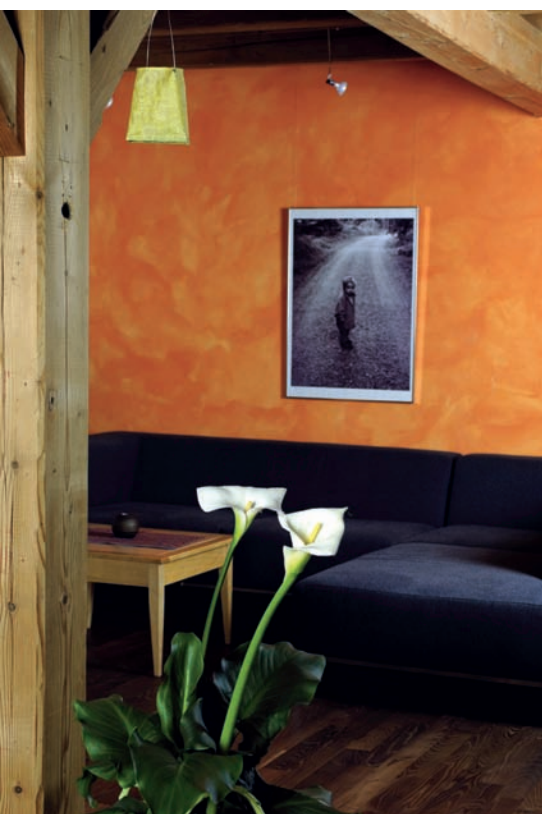
6 L'elemento fuoco simbolizza un forte rapporto di collaborazione.