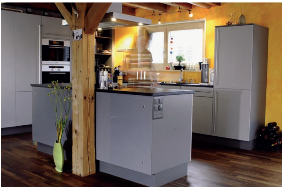
2 Abbinando il design freddo (Yin) della cucina con il colore caldo (Yang) delle pareti, si crea un equilibrio nel locale.

vo e positivo – formano il principio fondamentale della creazione. Nella configurazione dello spazio, l'attenzione è rivolta alla combinazione armoniosa di colore, materiale, forma e proporzione. Proprio perché l'architettura del nostro tempo è caratterizzata prevalentemente da materiali duri e spigolosi (Yang) come vetro, acciaio e calcestruzzo e dai colori bianco-nero, è importantissimo compensare con il polo Yin (fig. 2). Quando fenomeni naturali come grande e piccolo, chiaro e scuro, caldo e freddo, duro e morbido si abbinano, il potente flusso d'energia si manifesta ad