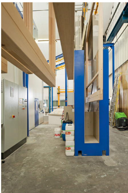
Automatische Fördersysteme transportieren die Fensterteile zu den Beschichtungsanlagen. Hinter der Flutanlage werden die Teile zum Abtropfen automatisch schräg gestellt.

nal verankertes, stadtnahes Maler- und Gipserunternehmen mit einer solchen Anlage ausrüsten lässt, erstaunt. Dies umso mehr, weil solche Investitionen sonst eher von grossen Fensterbauunternehmen getätigt werden. Blickt man aber auf die Entwicklung von Mordasini AG zurück, erscheint die Investition als logische Fortsetzung einer bewährten Strategie. Denn Fenster hat die Firma schon immer beschichtet. War man früher vorwiegend auf der Baustelle tätig, hat man später die Fensterteile im Maleratelier getaucht, geschliffen und im Handspritzstand beschichtet.