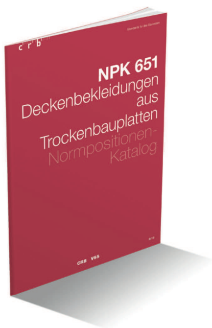
Das neue NPK-Kapitel.

Seit Januar 2016 steht den Anwendern des Normpositionen-Katalogs (NPK) das komplett überarbeitete NPK-Kapitel 651 «Deckenbekleidungen aus Trockenbauplatten» zur Verfügung. Es berücksichtigt den aktuellen Stand der Technik ebenso wie neue Begriffe, Vorschriften und Normen.