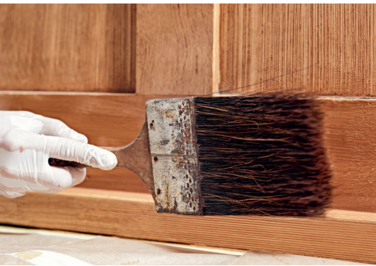
Angedacht ist ein neuer Abschluss Dekorationsmaler.

Eine gute Grundbildung ist die Basis der Weiterbildung. Beide können die Bedürfnisse der Berufsleute und der Branche nur dann befriedigen, wenn sie marktgerecht und auf dem aktuellsten Stand sind. Es ist die Aufgabe des SMGV, die Entwicklungen zu verfolgen und wo nötig Anpassungen vorzunehmen. Bei der Reform der Weiterbildung ist Diverses angedacht.