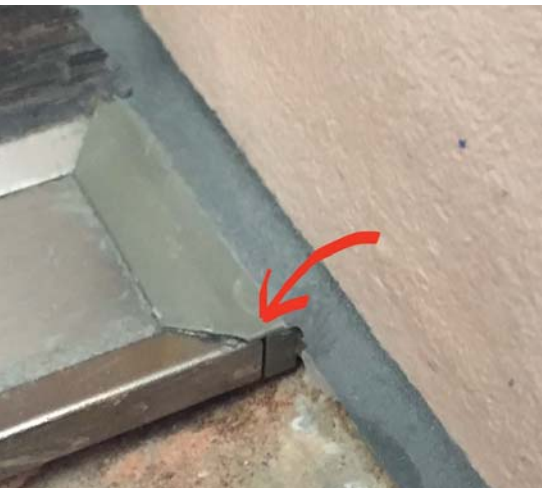
Gekürzte Enden der Duschrinne sind eine Schwachstelle.

Fugenlose Systeme versprechen eine neue, zeitgemässe Optik und eine pflegeleichte Oberfläche. Es handelt sich um Mehrschichtsysteme, die den neuesten architektonischen Trends entsprechen. Denn fugenlose Systeme ermöglichen die Realisierung nahtlos ineinander übergehender Beschichtungen. Es stellt sich daher die Frage, ob sie die Problemlöser der Zukunft sind.