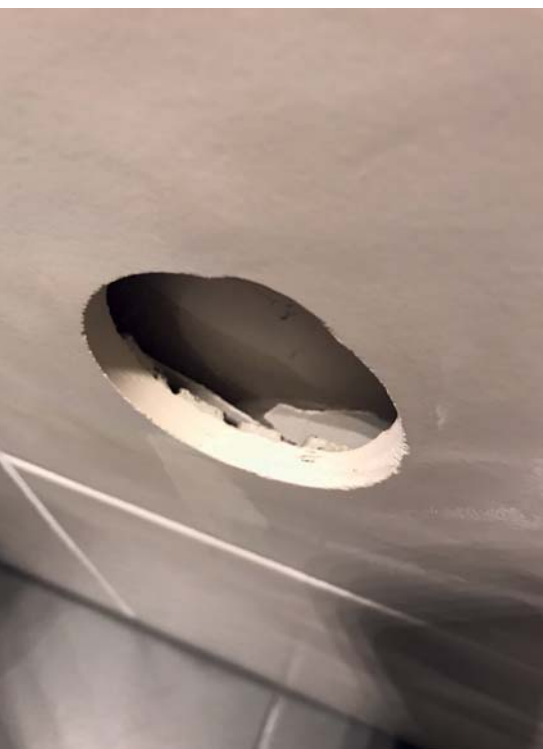
Hohlstellung des Fliesenbelags infolge Schwindung der Betonwand.

Die Baustoffe werden laufend weiter spezialisiert. Das verbessert die Performance und vermindert gleichzeitig den Einsatz schädlicher oder «verdächtiger» Hilfsstoffe. Weil sie immer wieder Diskussionen um die Eignung von Gips in Bädern und Küchen führen müssen, bieten einzelne Hersteller Gipsputze mit reduzierter Wasseraufnahme oder höherem Widerstand gegen Feuchtigkeit an. Leider bringt das immer noch zusätzlichen Aufwand für die Verarbeiter (und zusätzlich auch Kosten für den Bauherren) durch das Heranschaffen einer zweiten Putzsorte.