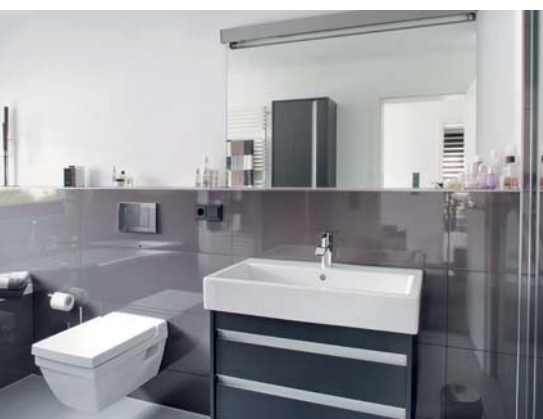
Modernes Bad mit hohem Putzanteil und grossformatigen Platten.

Gipsbaustoffe gewinnen im Bauwesen kontinuierlich an Bedeutung. Aufgrund ihrer positiven Eigenschaften erobern sie immer weitere Einsatzgebiete. Neben den klassischen Anwendungen werden Gipsprodukte seit Jahrzehnten auch erfolgreich in Bereichen mit geringer oder wiederholt kurzzeitiger Feuchtigkeitsbeanspruchung eingesetzt.