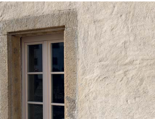
Typisches Bild eines Kalkputzes nach Verwitterung. Die Sandkörner treten hervor.

den, denn das würde sie zerstören. «Wir gingen sehr vorsichtig vor mit Wasser und Bürste», berichtet Leuzinger, teilweise hätten sie den Verputz mit einem Fixativ gefestigt.