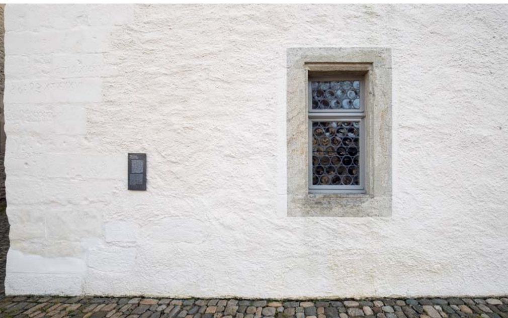
An der secco mit Kalk beschichteten Nordfassade zeigen sich die feuchten Stellen deutlich.

flächen gleichmässiger und damit «moderner» anmuten. Hier an Toranlage, nördlichem Bergfried, mittlerem Torhaus und der Nordfassade des Bernerhauses ist es windrichtungsbedingt schattig und besonders feucht. Beim Kalk hat die Verwitterung bereits nach einem halben Jahr wieder begonnen. An vorstehenden Stellen der Mauer blättert die Farbe ab. Diese beiden Phänomene sind wegen der besonderen Verhältnisse auch beim Reinsilikat festzustellen.