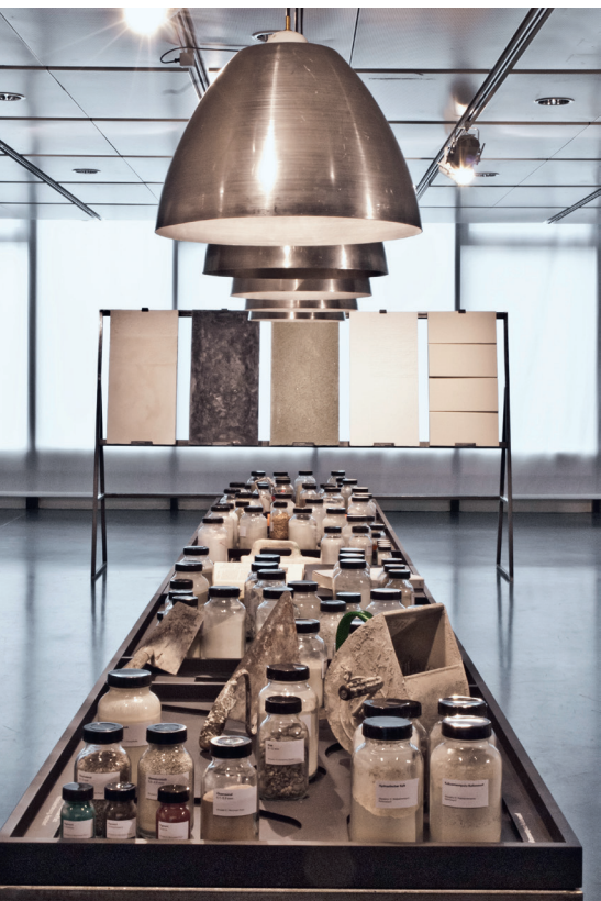
Putzmuster und Putzrezepturen, GTA-Ausstellung ETH Zürich, 2012. (Bild: Professur Annette Spiro, ETH Zürich)

«Der Künstler aber hat nur einen Ehrgeiz: das Material in einer Weise zu beherrschen, die seine Arbeit von dem Werte des Rohmaterials unabhängig macht. Unsere Baukünstler aber kennen diesen Ehrgeiz nicht. Für sie ist ein Quadratmeter Mauerfläche aus Granit wertvoller als aus Mörtel.» 1