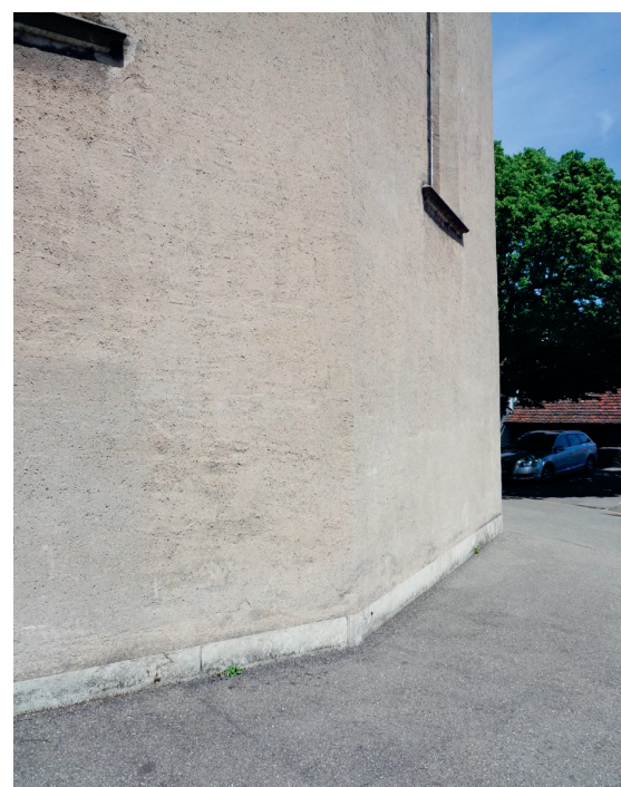
Die Putzfassade der Stadtkirche Baden diente als Referenz. (Bild: Meier Leder Architekten, Baden)

Die Deformationen der Fassade in vertikaler und horizontaler Richtung von fast 2 cm erforderten zudem spezifische Massnahmen im Aufbau der Schalen. Es war ein Putzsystem nötig, das eine gewisse Elastizität besitzt, um mögliche Rissbildungen der darunterliegen-