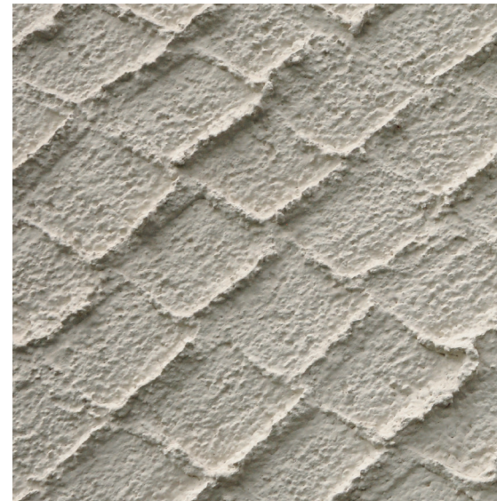
Historischer Stempelputz, Schulhaus Aemtler, Zürich.

als «nur» repräsentativer und dauerhafter Wetterschutz zu sein. Lässt sich mit Putzfassaden Energie gewinnen? Können Putze als Wasserspeicher, Nährboden für Pflanzen bei Fassadenbegrünungen oder Luftfilter dienen? Können sie aus Recyclingmaterialien bestehen und so zur Nachhaltigkeit der Baustoffe beitragen? Ein Bericht dazu ist publiziert worden (siehe Kasten linke Seite).