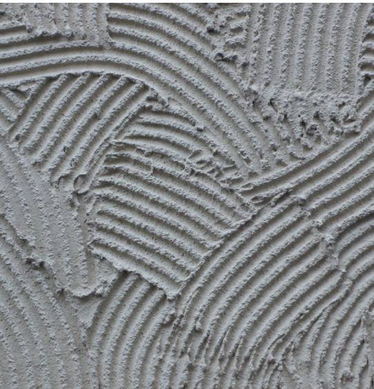
Historischer Kammputz, Zürich.