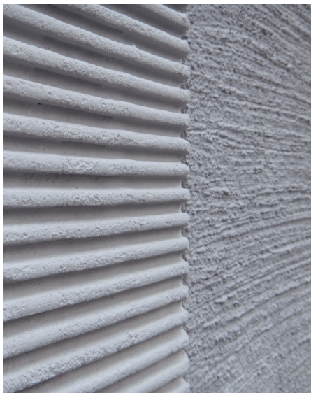
Kammputz auf WDVS, Hofstatt München, Meili, Peter Architekten, 2013.